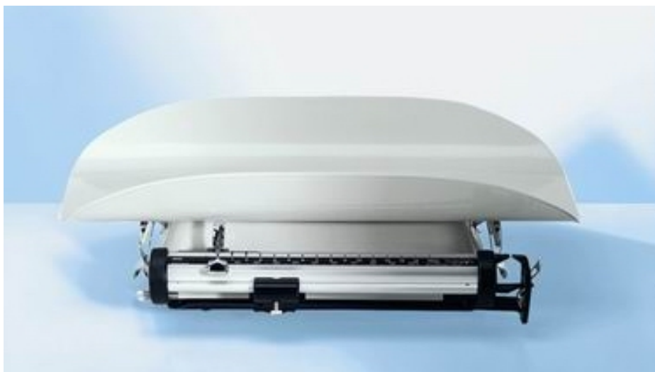
SECA 745 Slika 2